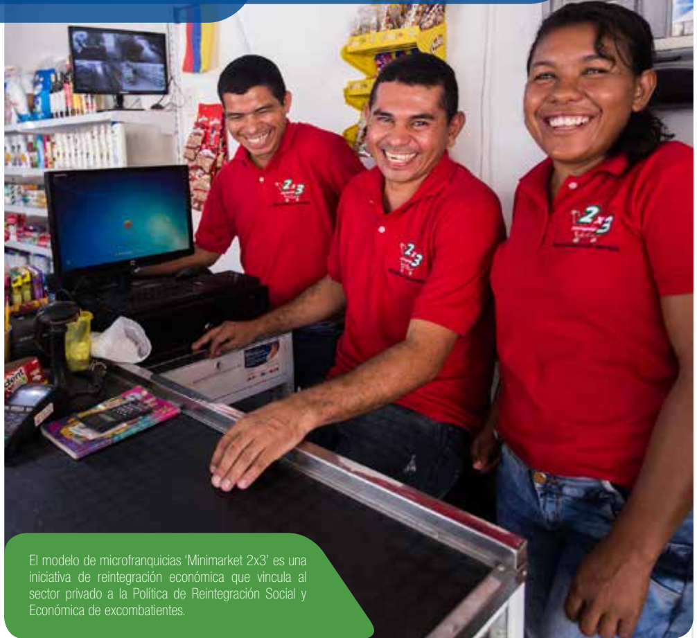
El modelo de microfranquicias 'Minimarket 2x3' es una iniciativa de reintegración económica que vincula al sector privado a la Política de Reintegración Social y Económica de excombatientes.